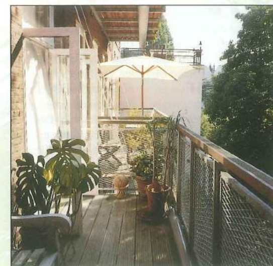
△ Hout heeft bij architect en bewoners de voorkeur, omdat dit het meest een tuin-gevoel geeft.

'Groot voordeel is dat je geen nieuwe voorzieningen hoeft te treffen, die als lelijke toevoegingen het aanzicht bederven. Bovenaan bij de woning-scheidende vloer maak je een gat in de muur en gaten in de vloerbalken. Daarmee maak je mooi gebruik van wat