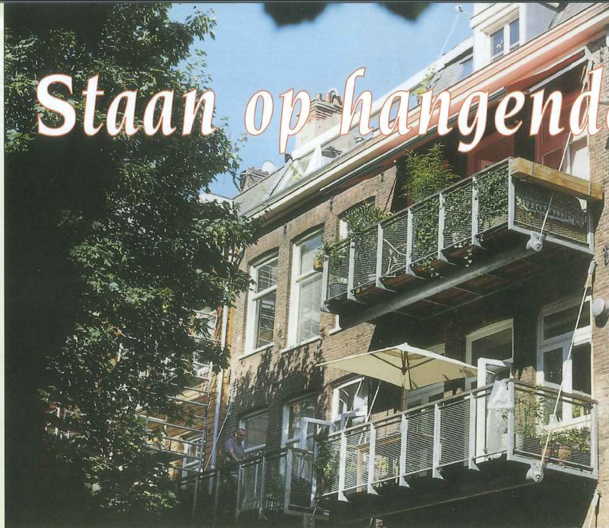
▷ De burens volgden het goede voorbeeld en bestelden ook een hangend balkon.